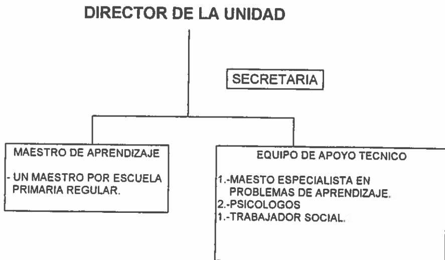
DIAGRAMA DE ORGANIZACION